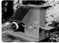
CHIPPER SHREDDER CS-33

Power Require : 5 to 10 H.P. Output Capacity : 500 Kg / hr. Engine Driven Model also available