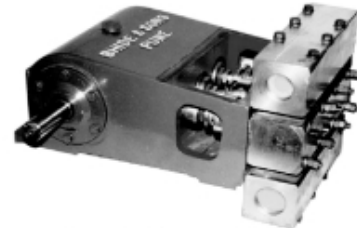
HIGH PRESSURE RECIPROCATING PUMPS (POWER PUMP)

Pressure - From 30 kg/cm 2 to 300 kg/cm 2 Application - Chemical Injection, Cleaning Drainage Pipes, Boiler feed etc.