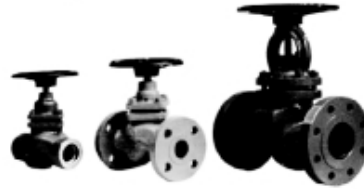
PISTON VALVES (FOR STEAM-LINE)

IBR & Non IBR Piston Valve Class 150, Class 300 & PN 40 Size 15 mm to 150 mm