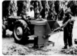
CHIPPER SHREDDER CS-50

Power Require : 15 to 20 H.P. Output Capacity : 1 Tonn / hr. Motor Driven & Engine Driven Model also available